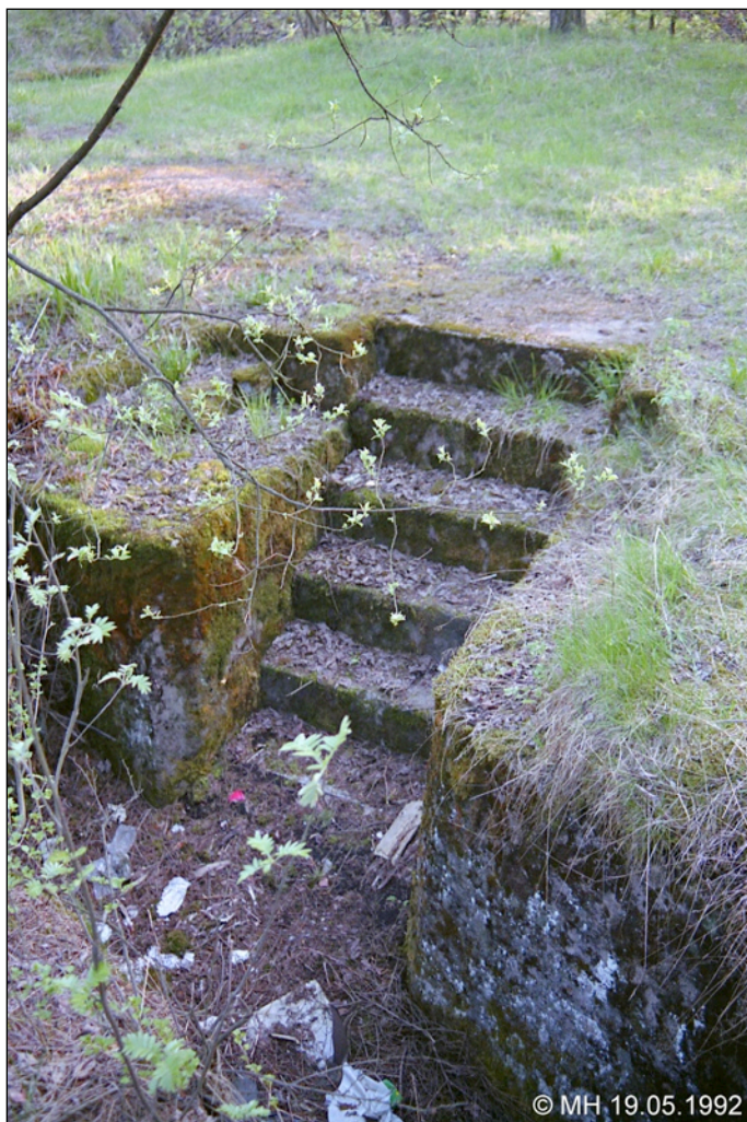
Mäen laella olevien suojahuoneiden 3/4 ja 3/5 välillä on syvää betonista juoksuhaudaa. Nämä portaat nousee suojalle 3/4 johtavasta käytävästä.