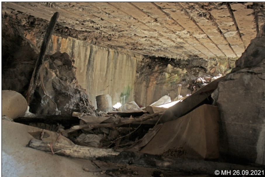
3. Suojahuoneen XXXV:3/2 sisätiloja.