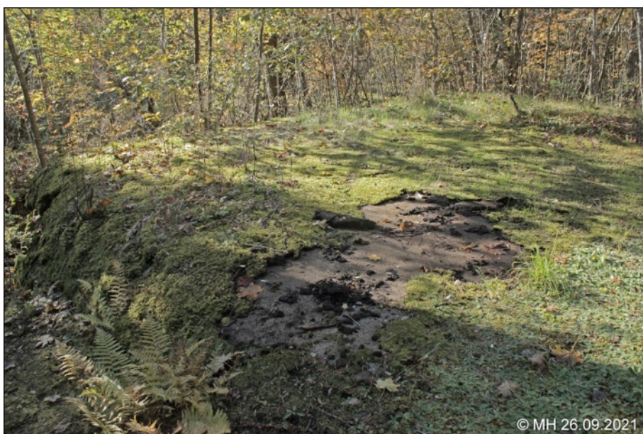
5. Suojahuoneen XXXV:3/2 katto on ohuen sammaleen peitossa.