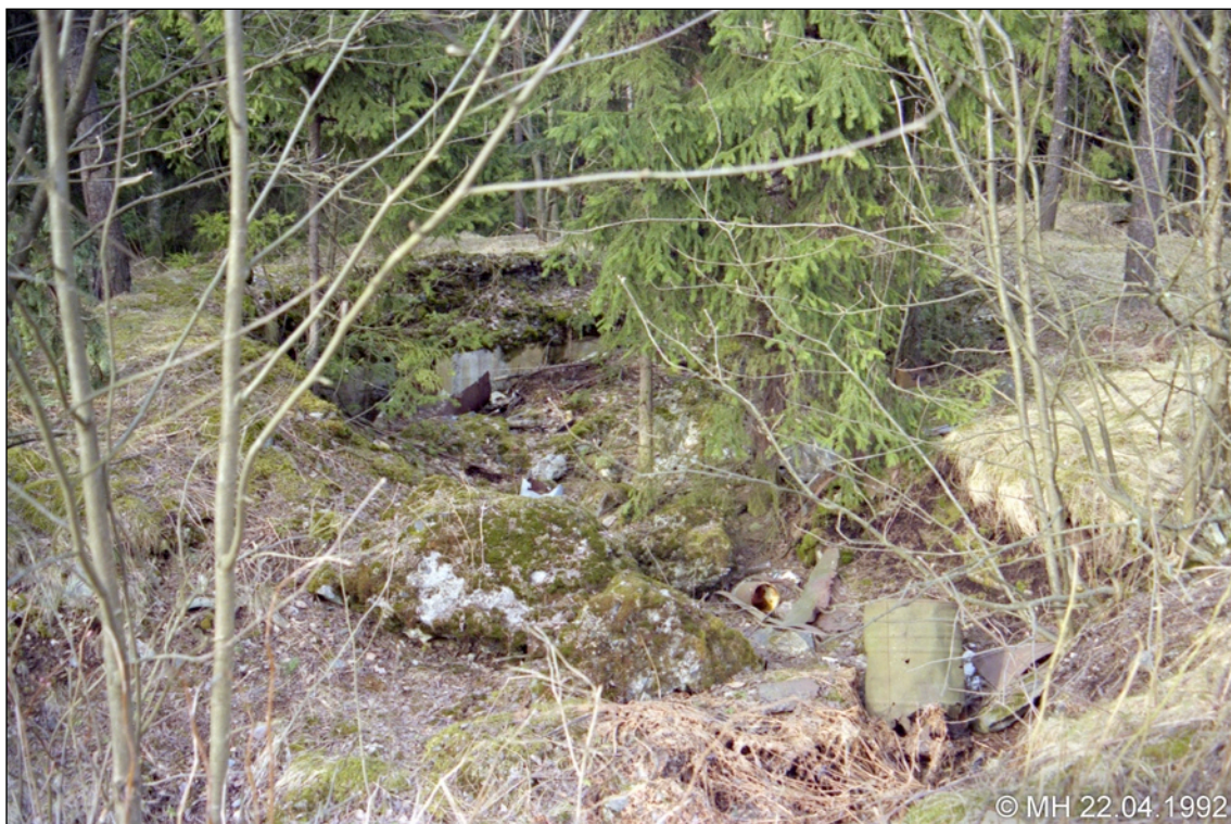
XXXV:3/5 Suojahuone ja sen takana mäen laelle nousevat portaati.